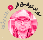
نویسنده: نازیف فرهاد

آمریکا گردید. در آنجا به عنوان دبیر شورای مرکزی جبهه ملی ایران، شاخه آمریکا و عضو هیئت اجرایی و مسئول تشکیلات جبهه، عضو هیئت تحریریه مجله «اندیشه جبهه» ارگان جبهه ملی فعالیت کرد و بعدتر در تأسیس نهضت آزادی ایران شاخه آمریکا و تأسیس پایگاه «آموزش جنگ‌های مسلحانه» ابتدا در مصر و جنوب لبنان مشارکت داشت. وی خودش را به هواپیمایی که امام خمینی (ره) با آن به ایران می‌آمد رساند و به ایران بازگشت تا معاون مهدی بازرگان در امور انقلاب باشد. او با جوی مقامات دستگیر شده رژیم سابق در مدرسه رفاه بود و با پایان یافتن عمر کوتاه وزارت کریم سنجابی، وزیر امور خارجه دولت موقت شد. در این دوره، وی پیشنهاد پس دادن هواپیماهای F۱۴ و تجهیزات آمریکایی ارتش را ارائه داد که موفق نشد اما همه قراردادهای ایران و آمریکا را به صورت یک‌جانبه فسخ کرد که موفق شد و میلیاردها دلار پول ایران نزد آمریکا را به آمریکا بخشید. آمریکا نیز به او پاسپورت و شهروندی آمریکا داد (۱۳۵۸). این شهروندی موجبات تعجب مطبوعات آن زمان آمریکا را فراهم کرد (تصویر ۱). با تسخیر لانه جاسوسی آمریکا در تهران و کشف اسناد جاسوسان و رابطه‌ها سیاه ایران، دولت بازرگان استعفا داد. ابراهیم یزدی هم مجبور به استعفا شد و تقریباً از همان سال جزء مخالفان دولت و مردم ایران شد. علی‌رغم این، آمریکا ابراهیم یزدی را برای درمان هم به آمریکا راه نداد و وی در سال ۱۳۹۶ در ترکیه و پشت در سفارت آمریکا، درگذشت.