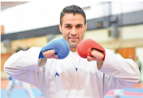
امیر صدیقی، رئیس فدراسیون ووشو گفت: «مسابقات انتخابی جام جهانی، اردیبهشت برگزار خواهد شد. در تدارک هستیم. مسابقات جهانی از این جهت برای ما اهمیت دارد که با اصرار و تلاش فدراسیون ایران و حمایت فدراسیون جهانی این مسابقات شکل گرفت تا کشورهایی که نتوانستند در مسابقات قهرمانی جهان آمریکا حضور داشته باشند در مسابقات یادشده سهمیه جام جهانی را دریافت کنند. قطعاً بررسی لازم را خواهیم کرد و احتمال تغییر و تحول در کادر فنی تیم‌های ملی وجود دارد اما این موضوع را به قبل از آغاز اردوهای تیم ملی در اسفندماه موکول کردیم.»