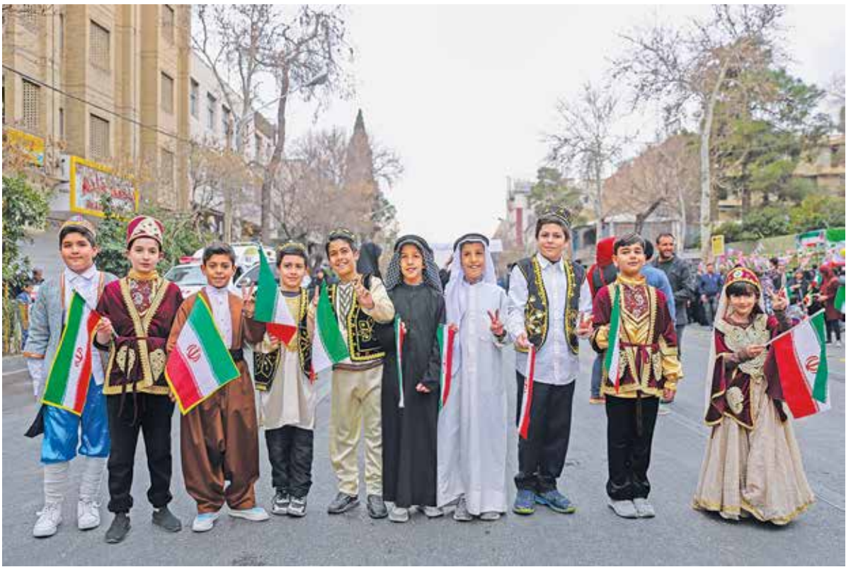
راهپیمایی ۲۲ بهمن ۱۴۰۲ در شیراز