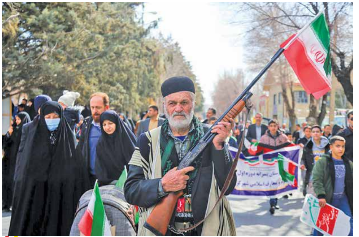
راهپیمایی ۲۲ بهمن ۱۴۰۲ در شهرکرد