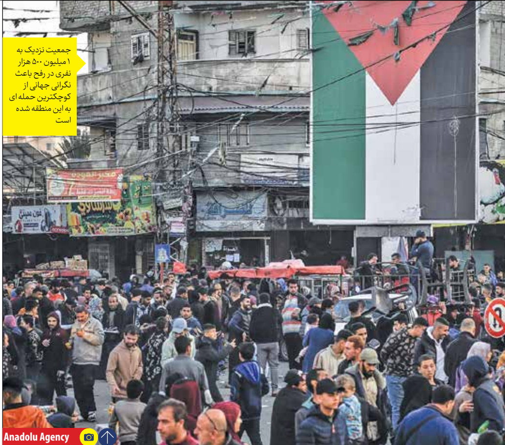
جمعیت نزدیک به ۱ میلیون ۵۰۰ هزار نفری در رفح باعث نگرانی جهانی از کوچکترین حمله ای به این منطقه شده است

بی‌بی سی نظر قاطعش برای حمله به رفح می‌گوید که اختلافات میان نخست‌وزیر رژیم صهیونیستی و رئیس ستاد ارتش این رژیم درباره عملیات احتمالی در شهر رفح غزه شدت گرفته است