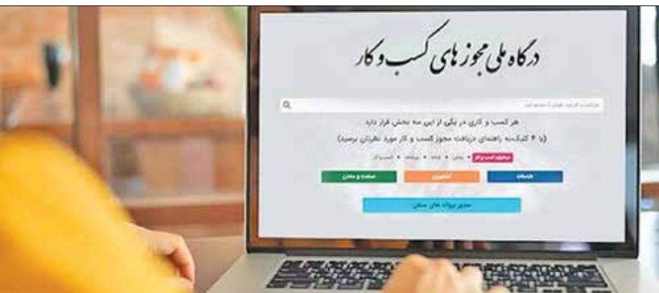
دگاه ملی مجوزهای کسب و کار

۱۱۴۲ شرط و مدرک ناهنجار از صدور مجوزهای کسب و کار کنار گذاشته شد