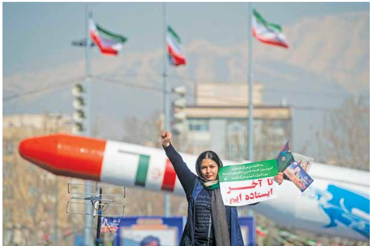
عکس: سجاد صفری / ایران ● راهپیمایی ۲۲ بهمن ۱۴۰۲ در تهران