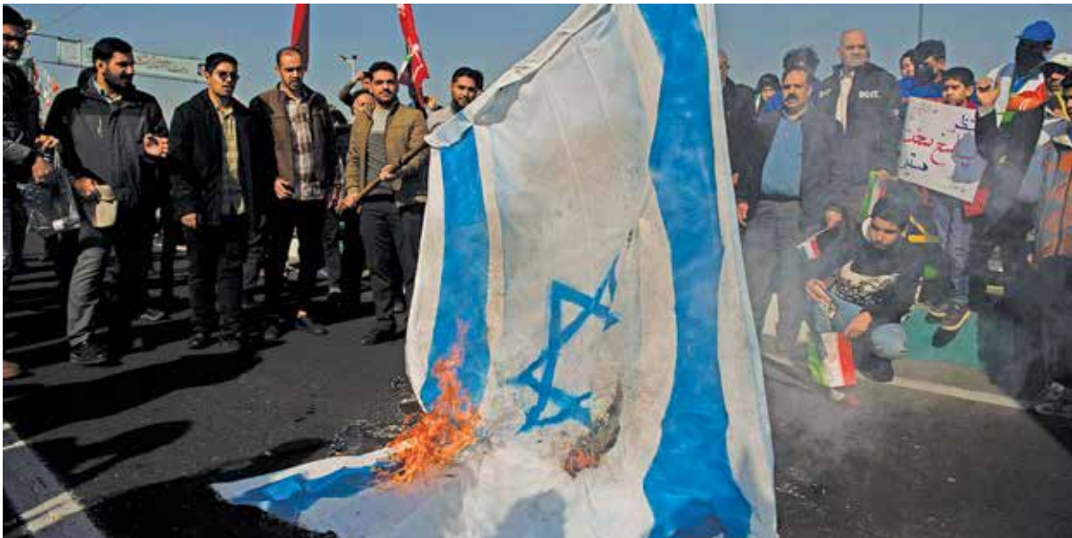
عکس: سجاد صفری / ایران ● راهپیمایی ۲۲ بهمن ۱۴۰۲ در تهران