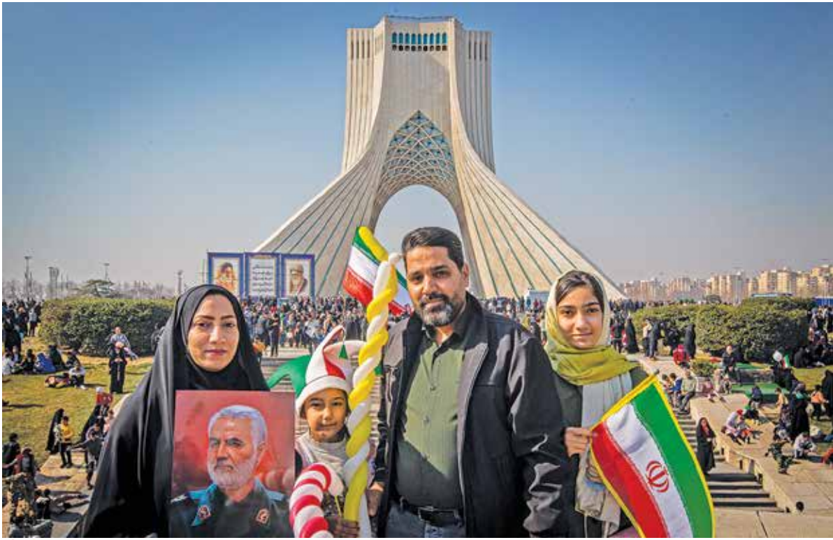
عکس: علی حسن پور / ایران ● راهپیمایی ۲۲ بهمن ۱۴۰۲ در تهران