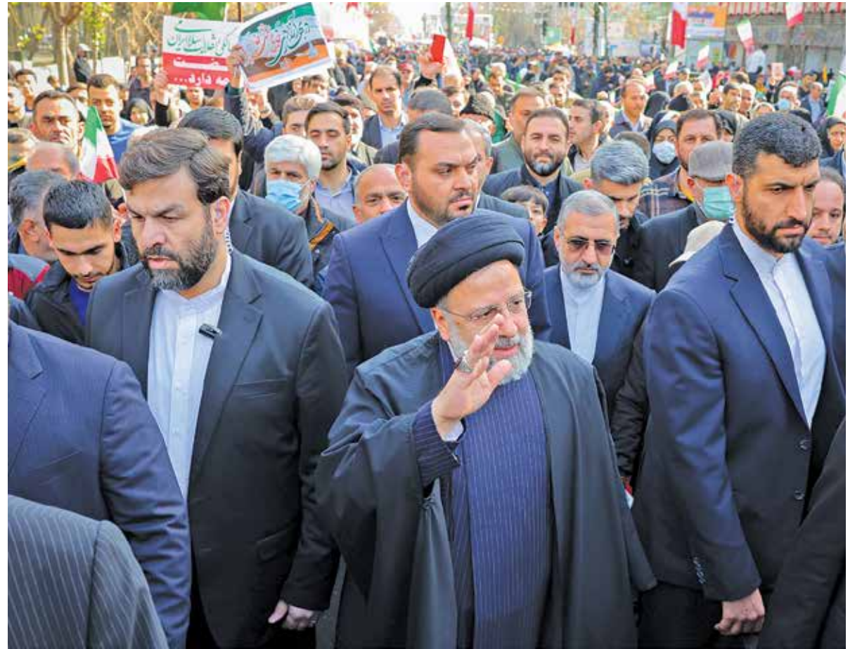
رئیس‌جمهور در جمع مردم در راهپیمایی ۲۲ بهمن ۱۴۰۲ در تهران