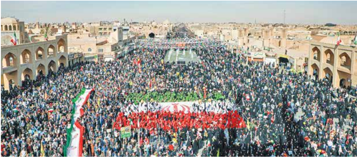
عکس: مجید جراحی / ایرنا ● راهپیمایی ۲۲ بهمن ۱۴۰۲ در یزد