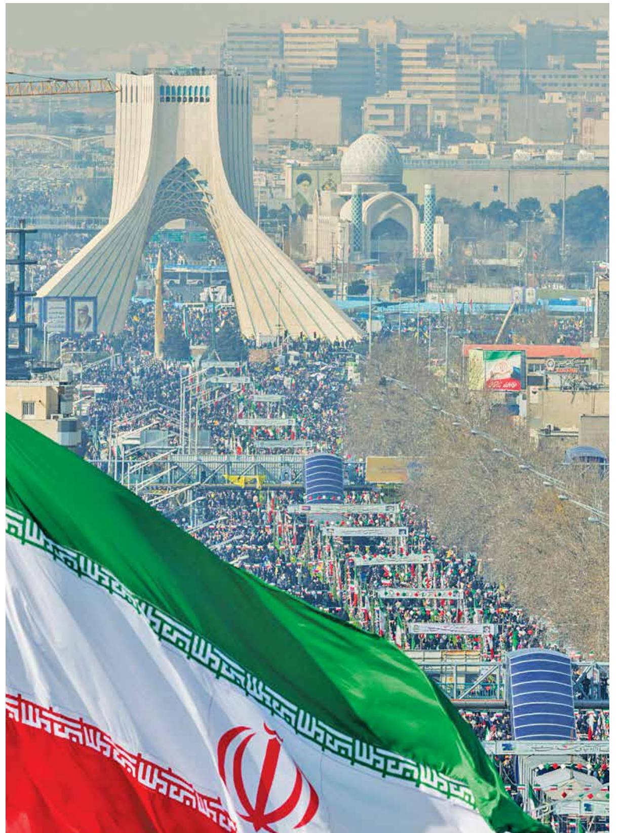
راهپیمایی ۲۲ بهمن ۱۴۰۲ در تهران