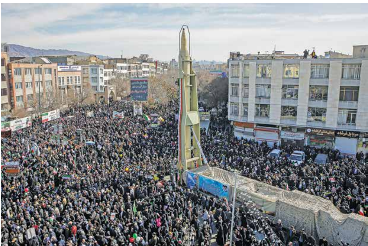
راهپیمایی ۲۲ بهمن ۱۴۰۲ در تبریز