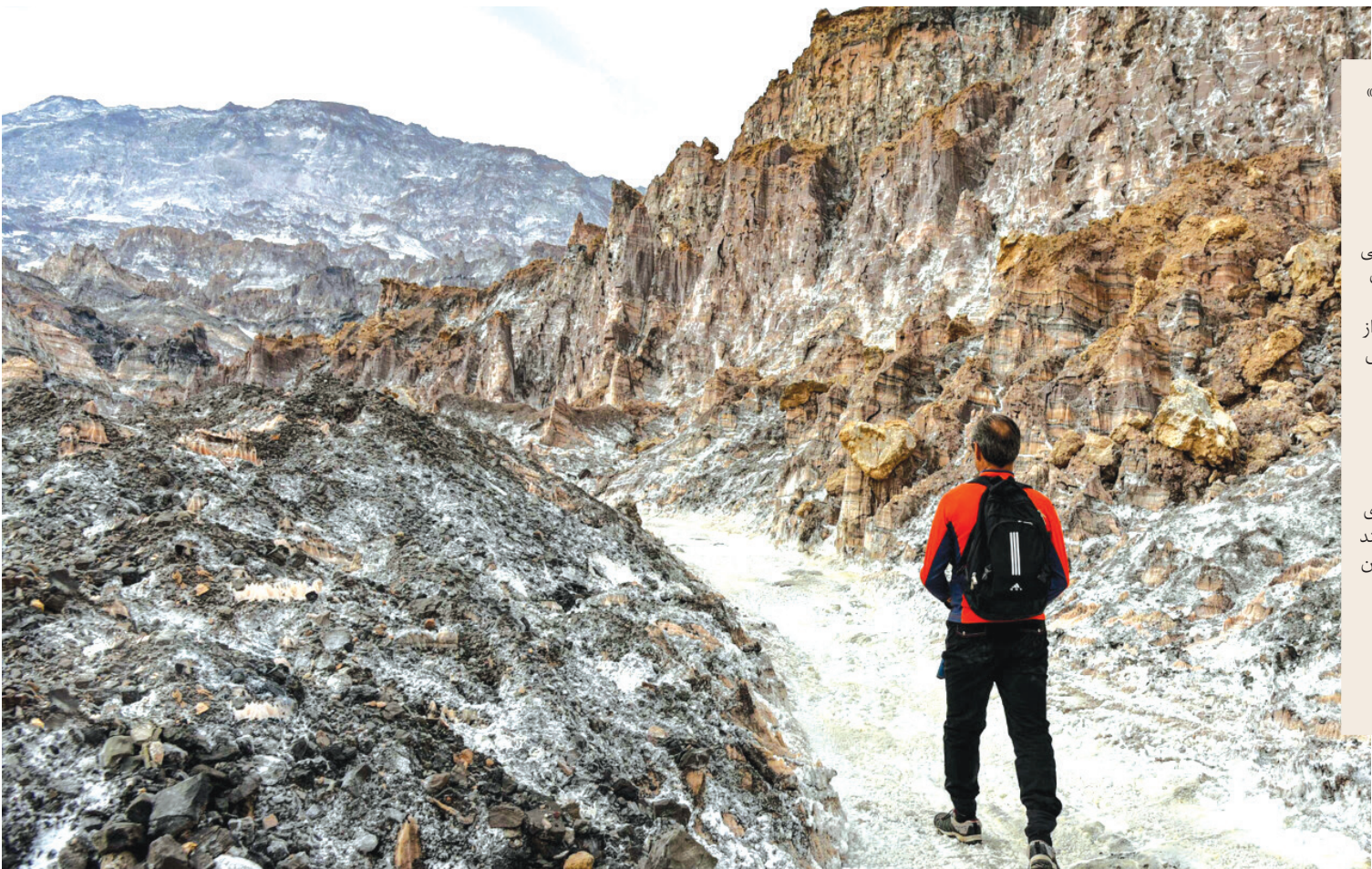
کوه نمکی «جاشک» با وسعت ۳ هزار و ۵۷۶ هکتار یکی از منحصربه فرد ترین جاذبه های گردشگری ایران در مرز شهرستان دشتی و دیراز توابع استان بوشهر واقع شده است. همانطور که از نام این کوه مشخص است در این منطقه نمک فراوانی یافت می شود. درخشش نمک در میان پرتوهای خورشید و انعکاس آن منظره ای بی نظیر ایجاد می کند و هر ساله گردشگران زیادی به دیدن آن می روند.