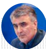
محمد رضا فرزین رئیس کل بانک مرکزی

کاهش نرخ رشد نقدینگی به ۲۵.۲ درصد در پایان دی‌ماه