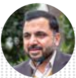
عیسی زارع پور وزیر ارتباطات و فناوری اطلاعات

برگزاری روز ملی فناوری فضایی با حضور رئیسی