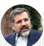
محمد مهدی اسماعیلی وزیر فرهنگ و ارشاد اسلامی

برگزاری روز ملی فناوری فضایی با حضور رئیسی