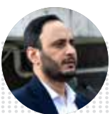
علی جهرمی سخنگوی دولت