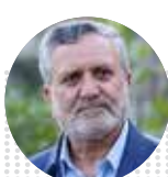
سید صولت مرتضوی وزیر تعاون، کار و رفاه اجتماعی

۲۶ هزار میلیارد تومان منابع وارد استان هرمزگان شد