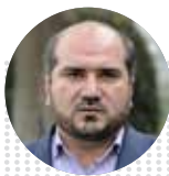
محسن منصوروی معاون اجرایی رئیس‌جمهور

کاهش نرخ رشد نقدینگی به ۲۵.۲ درصد در پایان دی‌ماه