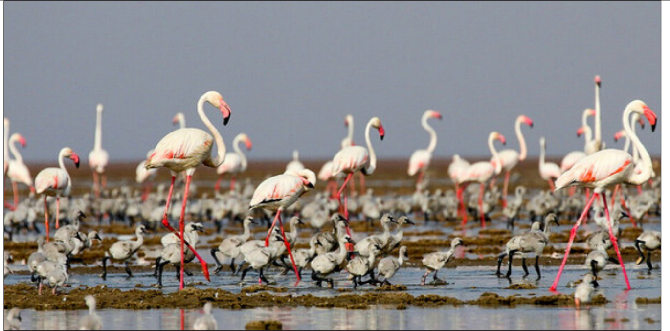
عکس تزئینی است / ایسنا

وی درباره میزان اثرگذاری این طرح ها در احیای تالاب می گوید: بختگان تالابی بسیار وسیع است و پهنه ای که برای بختگان به عنوان بستر تالاب تعریف شده بسیار گسترده است، بنابراین حوضه آبریز آن وسعت زیادی دارد. در واقع پروژه ما تنها در پاپلوت های بسیار محدود که شاید حتی یک درصد حوضه هم نباشد در حال فعالیت است. اما بنا بر پایش های که انجام داده ایم ثابت شده که اثربخشی فعالیت های ما در سطح مزرعه و