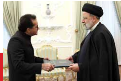
آیت‌الله رئیسی در آیین دریافت استوارنامه سفیر اسلام آباد تأکید کرد