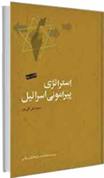
استراتژی پیرامونی اسرائیل / محمد تقی تقی پور / موسسه مطالعات و پژوهش های سیاسی

تلاش و تکاپوی اطلاعاتی و جاسوسی اسرائیل در منطقه استراتژیک خاورمیانه و به عبارتی قاره آسیا و آفریقا به قدری حائز اهمیت است که نیاز به یک بازبینی دقیق دارد. کتاب حاضر به تحلیل و تشریح اسرار عملیات های رژیم صهیونیستی پرداخته و استراتژی اسرائیل را تبیین کرده است که همان ایجاد دولت اسرائیل در سرزمین تاریخی نیل تا فرات و سیطره بر تمامی جهان است.