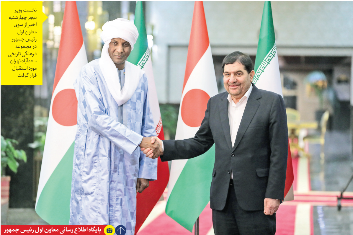
پایگاه اطلاع رسانی معاون اول رئیس جمهور