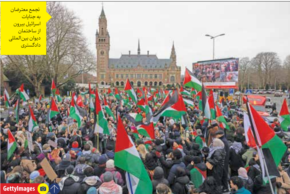
تجمع معترضان به جنایات اسرائیل بیرون از ساختمان دیوان بین المللی دادگستری