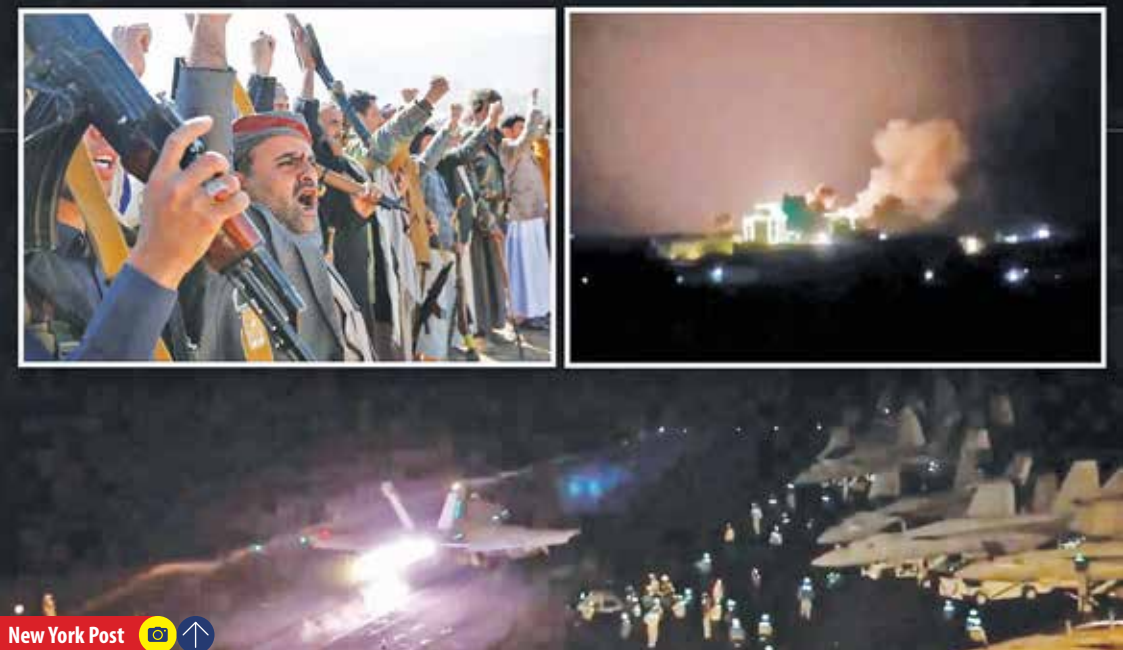
New York Post

به کشتی‌های تجاری صورت می‌گیرد. این درحالی است که با وجود حملات غربی‌ها، ارتش یمن همچنان کشتی‌های مرتبط با رژیم صهیونیستی را هدف می‌گیرد. یک مقام دفاعی آمریکا به الجزیره گفت: حملات علیه مواضع حوثی‌ها (انصارالله) یمن گسترده و چندجانبه بوده و توسط نیروهای آمریکایی و انگلیسی و با پشتیبانی عملیاتی سایر کشورهای انجام شده است. یمنی‌ها بارها تأکید کرده‌اند به تجاوزات آمریکا و انگلیس پاسخ می‌دهند و حملات به کشتی‌های مرتبط با رژیم صهیونیستی تا زمان پایان حملات نظامی علیه غزه ادامه می‌یابد.