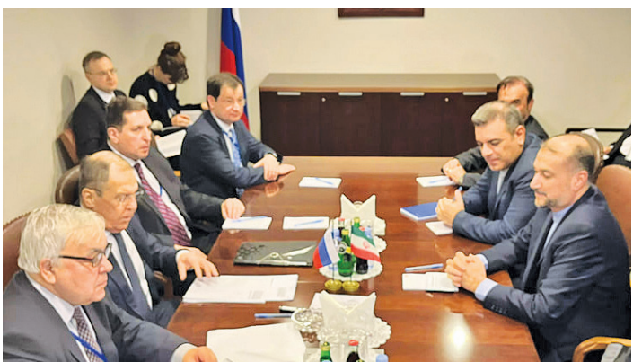
دیدار هیات ایران و روسیه در نیویورک

تصاویر ماهواره‌ای نشان می‌دهد که در همان ساعاتی که آمریکا حملاتی را علیه یمن انجام دادند، حدود ۲۳۰ کشتی تجاری و نفتی غیر صهیونیستی در دریای سرخ در حال حرکت بوده است