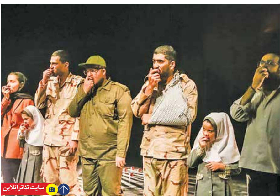
سایت تئاتر آنلاین

دروغ‌گویی، می‌توان گفت که این اثر یکی از نمایش‌های مدرن و در ساختار اپیزودیک اعتقادی است؛ اما بی‌جز دیدگاه‌های اعتقادی ساختار کلی اثر دارای مفاهیم خاصی نیست. هست.