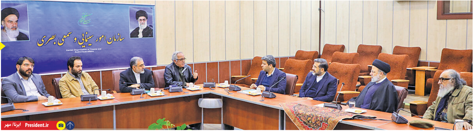
تمدن ایرانی اسلامی در قاب سینما

تمدن ایرانی اسلامی داشته‌های فرهنگی، هنری و ادبی ارزشمندی مؤثرترین روش‌های ارائه آن به دنیا به تصویر کشیده شدن این داشته‌ها در قالب سینماست