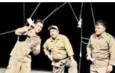
• عکس: ترتیبی است

می‌گویم که آثار شرکت‌کننده در اغلب جشنواره‌ها را می‌توان به چند گونه مختلف بخش بندی کرد. نمایش‌هایی که تاریخ انقضا داشته، کنار رفته و براساس محتوایی نه چندان جذاب شکل گرفته‌اند. نمایش‌هایی متوسط و بدون خلاقیت که در کل منبای این هنر را زیر سؤال می‌برند؛ چراکه هنر تئاتر به خلاقیت و نوآوری زنده است و نمایش‌های ضعیف، چه در شکل و چه در محتوا آسیب‌زننده هستند. در جشنواره تئاتر منطقه‌ای خاوران چند اثر قدرتمند هم حضور داشتند که از عناصر بومی، آیینی و مذهبی بخوبی در کارهایشان بهره برده بودند. درباره محتوای آثار باید بگویم که نکته مهم انطباق بر محتواهایی نظیر ارزش‌های ملی، اجتماعی و خانوادگی نیست، بلکه مسأله مهم چگونگی ارائه آن به مخاطبان است، ما می‌توانیم با اجرایی بد، فرهنگ و آیین مذهبی ملی‌مان را زیر سؤال ببریم، اما اگر با تحقیقی جهانشمول و درست و منطبق بر معیارهای درست هنری (تکنیک) در شکل و بیان کردن دقیق محتوا (اصل برصداقت) حرکت کنیم، چه بسا گشتی تئاتر ایران به محملی اقیانوس نورد بدل شود که چشم هنرمندان خارجی را نیز بربراید، همچنان که در قدیم بارها هنر تعزیه و دیگر گونه‌های نمایشی ایرانی‌سنتی‌مان توسط خیلی از کارگردان‌های دنیا دیده شده و حتی گاهی الگوبرداری هم شده است. نکته آخری که بر آن تأکید دارم این است که جمع‌شور و درک می‌تواند هنرمند را موفق کند و از هم‌نشینی این دو عامل است که او را به سرمنزمل مقصود می‌رساند.