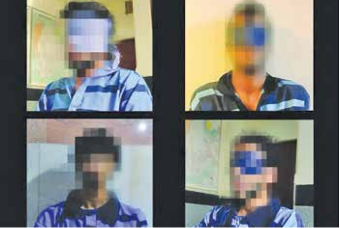
عوامل بازداشتی حادثه تروویستی راسک

تهران تقاهمنامه ۴۰ میلیارد دلاری برای توسعه مبادین گاز طبیعی ایران را امضا کردند. زیر سایه چنین تحولاتی است که تحلیلگران غربی از قدرت‌گیری رو به ارتقای منطقه‌های ایران سخن می‌گویند که در چندین دهه گذشته بی‌سابقه بوده است. «روئل مارک کریچت» و «ری تکیه» تحلیلگران مسائل سیاسی می‌گویند: «امروز، روحیه جمهوری اسلامی حسن بیروزمندانانه است. از تحریم‌ها عبور کرده، به کمک متحدان قدرتمندش، اقتصاد خود را تثبیت کرده و شروع به پر کردن ذخایر دفاعی خود کرده است.» سایمون تیسدال، تحلیلگر روزنامه گاردین نیز تأکید دارد: «ایران پس از ۴۵ سال تلاش، بالاخره بچه بزرگ این بلوک شده است. تحریم، رشد شدگی و تهدید تهران کارساز نبوده است. ایالات متحده، بریتانیا و اسرائیل - با یک حریف بزرگ روبرو هستند. آن‌گر می‌خواهیم از یک درگیری بزرگ‌تر جلوگیری کنیم، نیاز فوری به یک رویکرد دیپلماتیک تازه است.»