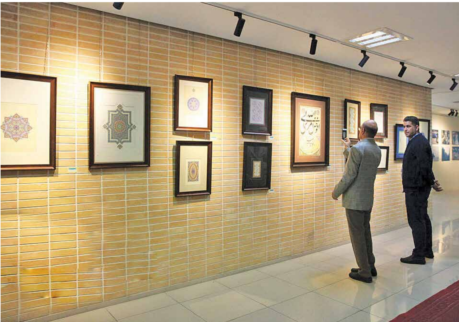
• مراسم افتتاحیه

دومین نمایشگاه هنرهای تجسمی ایثار با حضور هنرمندان استان‌های فارس، اصفهان، یزد، بوشهر، هرمزگان، کرمان و کهگیلویه و بویراحمد، در نگارخانه مؤسسه ایثار فارس برگزار شد.