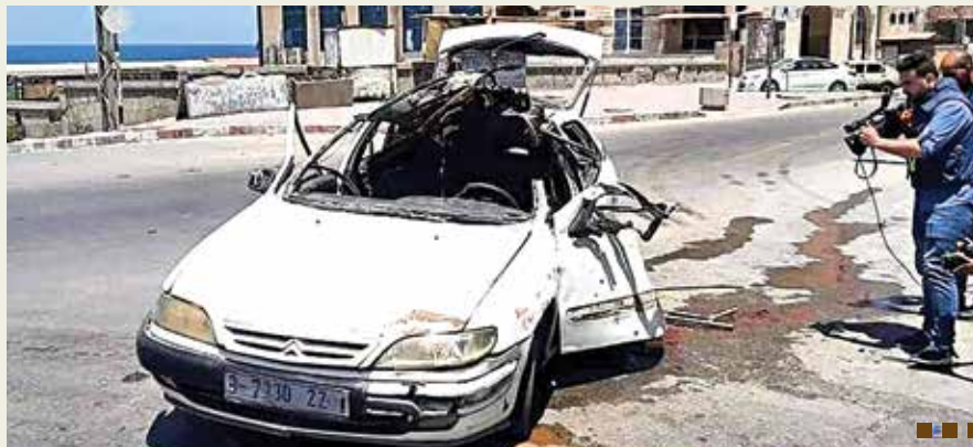
فیلم / عملیات ترور در پخش مستقیم المیادین

موشک های هدایت شونده که می توانند توسط بالگردها یا پهپادها حمل شوند، به صورت گسترده در نبردهای مختلف سراسر جهان استفاده می شوند. به گفته «رایان برابست»، تحلیلگر بنیاد موسوم به «دفاع از دموکراسی» در واشنگتن، تا کنون بیش از ۱۰۰ هزار موشک هلفایر به دولت آمریکا و دیگر کشورها فروخته شده است. برابست می گوید: «این موشک می تواند برای نابودی اهداف مشخصی چون خودروها و ساختمان ها آسیب کافی را به وجود آورد اما