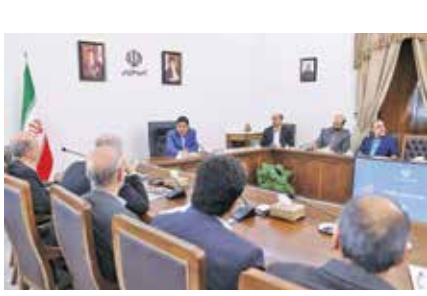
معاون اول رئیس‌جمهور: