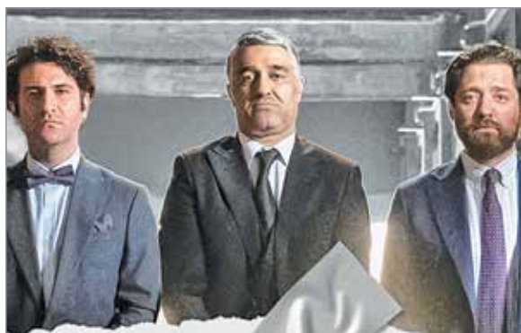
صحنه با زرافه ها