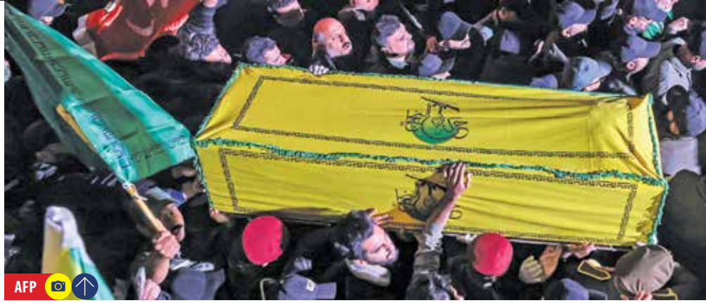
حضور نیروهای آمریکایی در عراق تعیین خواهیم کرد

به دولت و تابع آن هستند که بخشی جدایی ناپذیر نیروهای مسلح عراق به شمار می‌روند. وی درباره جنایت آمریکا در ترور فرماندهان مقاومت گفت: «حمله‌ای که به شهادت ابومهدی المهندس و قاسم سلیمانی منجر شد، ضربه‌ای به تمام هنجارها و قوانین حاکم بر روابط ما با واشنگتن بود.»