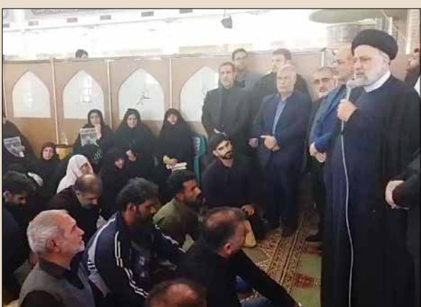
دیدار و تسلیت به خانواده‌های شهید