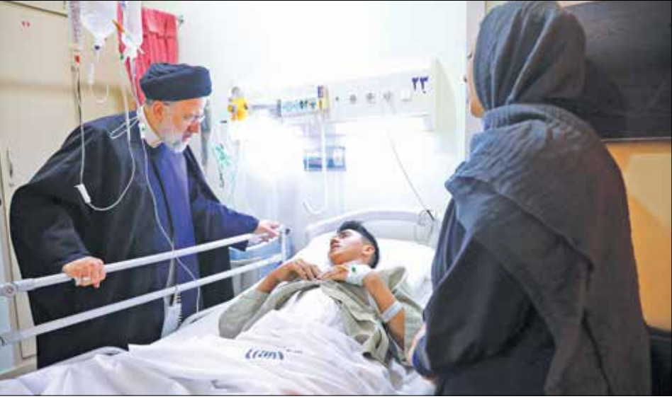
ملاقات رئیس‌جمهور با مجروحان