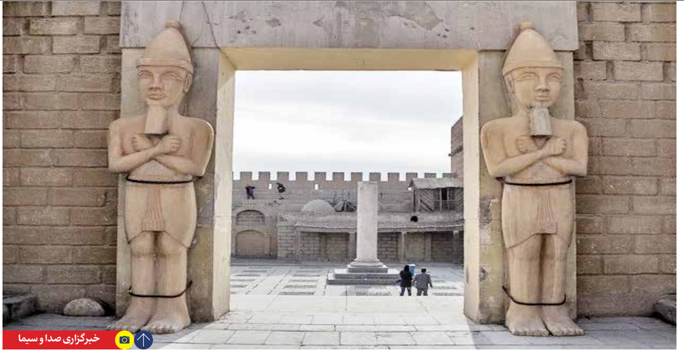
خبرگزاری صدا و سیما