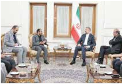
در پی سفر هیأت سیاسی یمن به ایران رقم خورد

معاون اول رئیس‌جمهور در جلسه ستاد هماهنگی و راهبری اجرای نقشه مهندسی فرهنگی با تأکید بر لزوم مراقبت و نظارت دقیق نسبت به نحوه هزینه کرد بودجه‌های فرهنگی گفت: اجرای پروژه‌های مصوب در نقشه مهندسی فرهنگی کشور مانند نفسی تازه برای حوزه فرهنگ ایرانی-اسلامی است. بنابراین باید به گونه‌ای تدبیر شود که بودجه‌های تخصیصی، در راستای اجرای برنامه‌های فرهنگی اولویت‌دار استان‌ها با محوریت گروه‌های مردمی و سازمانهای مردم‌نهاد هزینه شود تا شاهد اثرگذاری این پروژه‌ها در حل مهم‌ترین مسائل فرهنگی هر استان باشیم. در این جلسه همچنین گزارشی از اقدامات ستاد ارائه و اعلام شد که تا کنون ۱۰ سند ملی تصویب و ابلاغ شده و ۱۲ برش استانی نیز به اتمام رسیده و تا پایان سال برش‌های سایر استان‌ها نیز نهایی خواهد شد. براساس این گزارش، با اقدامات ستاد، ابلاغ ۱۰ سند ملی و تدوین برش‌های استانی، در حال حاضر زیرساخت مناسبی برای اجرای مصوبات ستاد در کشور وجود دارد و تعاملات مناسبی میان دستگاه‌های اجرایی برای اجرای این برنامه‌ها شکل گرفته است. در این جلسه همچنین گزارشی از سوی دبیرخانه در خصوص بازبینی آیین‌نامه شورای فرهنگی عمومی استان‌ها که قرار بود توسط کمیته شست‌نفره انجام شود، ارائه و توضیحاتی در خصوص اصلاحات صورت گرفته در این آیین‌نامه مطرح شد.