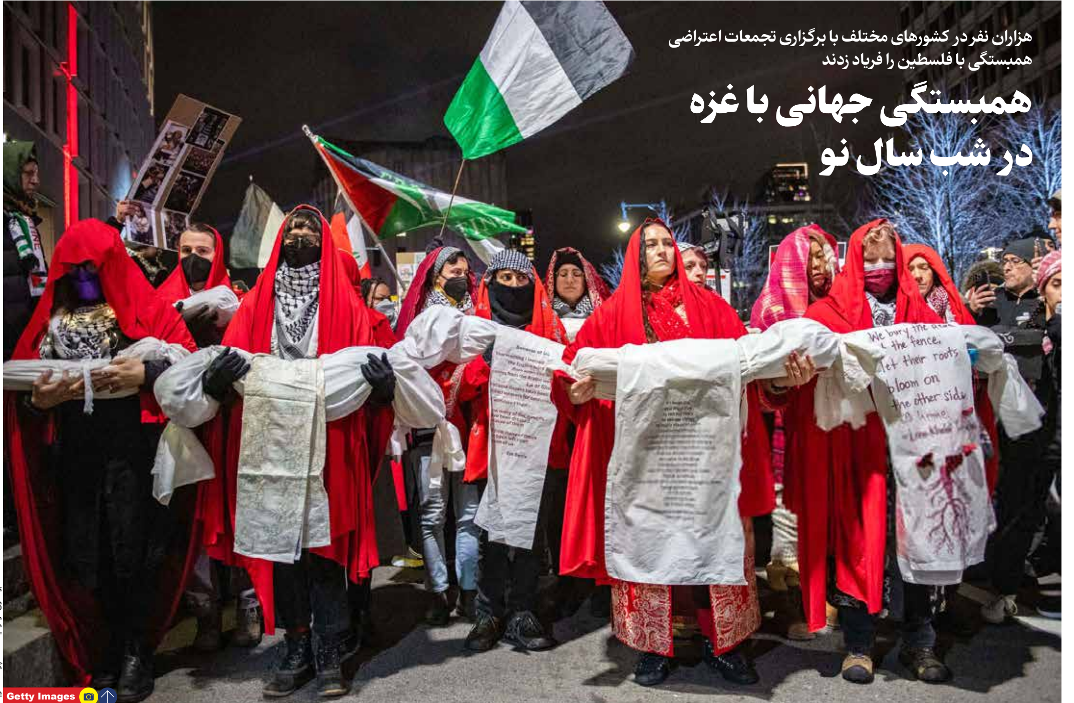
زنگ سال ۲۰۲۴، در سایه کشتار بی امان غیرنظامیان غزه صدایی بلندتر از قبل داشت: صدایی که بسیاری از ساکنان کره خاکی را حتی با وجود ممنوعیت های امنیتی به خیابان ها کشاند تا این بار در زمانی که آتش بازی های رنگارنگ آسمان را روشن کرده بود، با شعار علیه جنایتکاران صهیونیست، مظلومیت مردم فلسطین را فریاد بزنند.

خبر اسامه حمدان: هیچ چشمی نمی تواند نقش حاج قاسم را در پیروزی فلسطین نادیده بگیرد «اسامه حمدان» از رهبران جنبش حماس در لبنان دیروز (دوشنبه، ۱ ژانویه) در مراسم بزرگداشت شهید سید قاسم سلیمانی و شهید ابومهدی المهندس گفت: «طوفان الاقصی تنها برای غزه نبود، بلکه برای ایجاد مسیر آزادی بود و فرماندهان غزه با توانایی و درایت در میدان نبرد و سیاست، در حال مدیریت آن هستند.» وی افزود: غزه یک پیروزی را به دست امت (اسلامی) می سپارد که به فکر دشمنان نیز نمی رسد و مردم لبنان، یمن و عراق این پیروزی را به دست می آورند. این رهبر حماس افزود: در این نبرد، هیچ چشمی نمی تواند نقش، عملکرد و تأثیر حاج قاسم سلیمانی و کسانی را که به عنوان هم‌رزم و رفیق او یا سرباز او کار کرده‌اند، نادیده بگیرد.