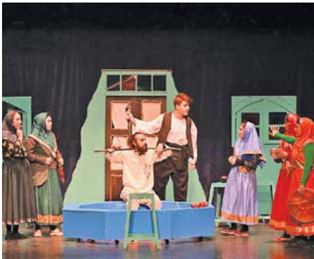
پیچ‌پچه‌های پستوی عمارت حاج احمد وکیل