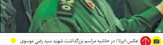
در حاشیه مراسم بزرگداشت شهید سید رضی موسوی

حسین امیر عبداللهیان با بیان اینکه تردید نکنید مسیر و راه سید رضی ادامه پیدا می‌کند، اظهار داشت: رژیم جنایتکار صهیونیستی و روسی ناجوانمردانه ترور کرد، اما این ترور چیزی از اهداف جمهوری اسلامی ایران برای تأمین حداکثری امنیت در منطقه و کشورمان نخواهد کاست بلکه ما را در این مسیر