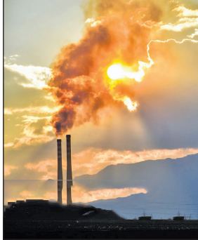
تأیید مازوت‌سوزی در نیروگاه حرارتی تبریز و آنبات آن از طریق پایش محیط زیست آذربایجان شرقی نیز با

درست است. نمی‌توان منکر تأثیرات مثبت لغو وارد شد؛ اما اگر دستگاه‌های دیگر مثل وزارت راه، هواپیمایی و... نخواهند یا وزارت میراث فرهنگی همکاری کنند از این گام می‌توان انتظار معجزه داشت؟