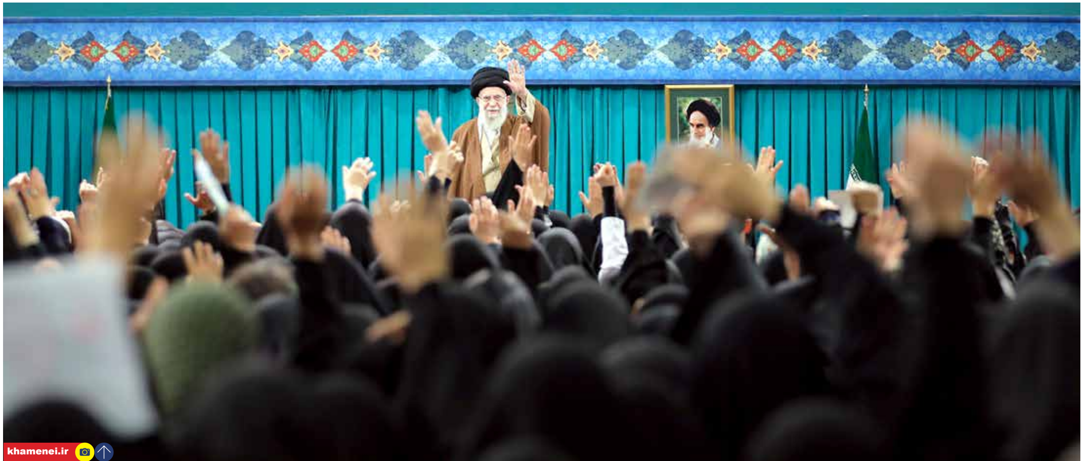
رهبر انقلاب در دیدار هزاران نفر از زنان و دختران: