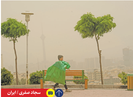
سجاد صفری / ایران

وزیر بهداشت، درمان و آموزش پزشکی با بیان اینکه هفت هزار تخت بیمارستانی آماده بهره‌برداری در ماه‌های آینده است، گفت: در ۲ سال گذشته حدود ۲ هزار خانه بهداشت افتتاح شده‌است و ۲ هزار خانه بهداشت دیگر نیز آماده افتتاح داریم.