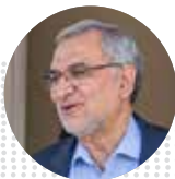
بهرام امینی وزیر بهداشت، درمان و آموزش پزشکی

رئیس سازمان انرژی اتمی کشورمان، ادعای جدید آژانس بین‌المللی انرژی اتمی مبنی بر افزایش سرعت غنی‌سازی اورانیوم در ایران را یک جنجال رسانه‌ای توصیف کرد و گفت: با توجه به شرایط سیاسی و وضعیتی که در غزه برای طرف مقابل پیش آمده است، آنان تلاش می‌کنند فضای دیگری را ایجاد کنند.