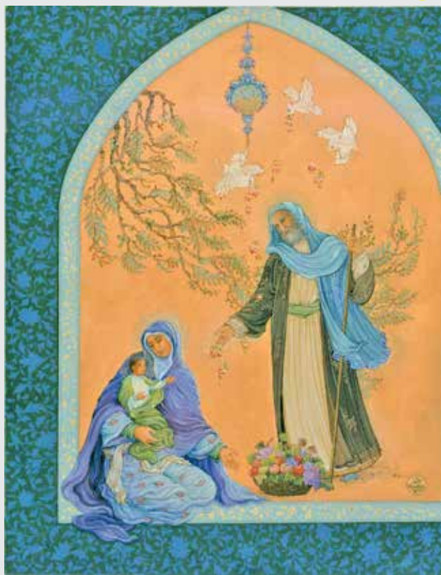
رضا پدرا السماء / نقاش و نگارگر