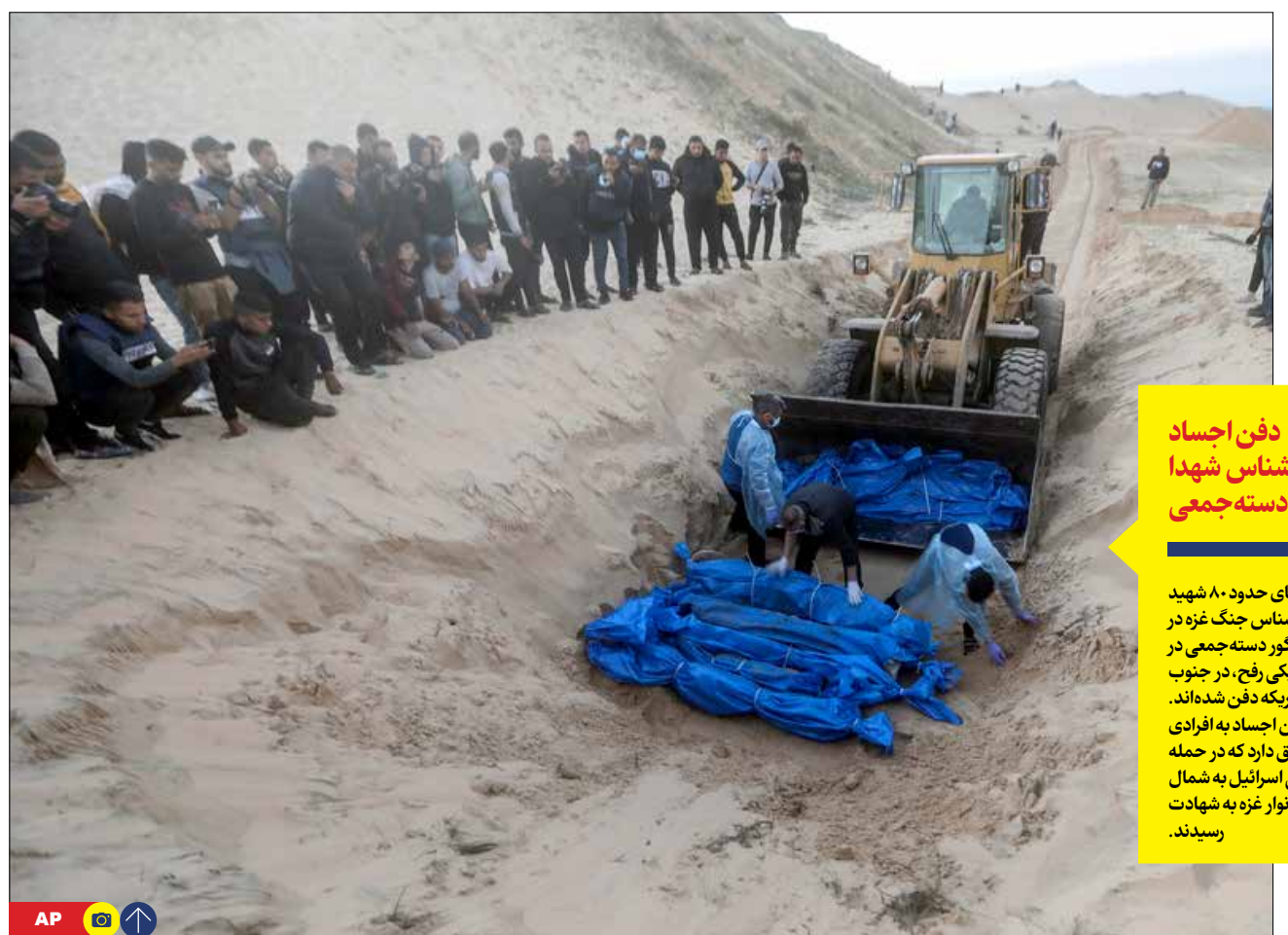
دفن اجساد ناشناس شهدا در گور دسته‌جمعی

رئیس سازمان برنامه و بودجه درباره مالیات خرید و فروش طلا گفت: اتفاق جدیدی رخ نداده و قانون ارزش افزوده درباره خرید و فروش طلا مصوب سال ۱۴۰۰ تغییری نکرده است. داوود متظور افزود: طلا مشمول مالیات نمی‌شود بلکه اجرت ساخت طلا مشمول مالیات بر ارزش افزوده می‌شود.