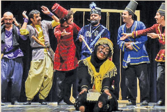
فرهنگی خانواد در تقاد می‌بینند، اما هنرمندان تئاتر در شهرها و استان‌های کشور به واسطه کمبود امکانات و زیرساخت‌های نمایشی، از آن استقبال می‌کنند.

نمایش صحنه‌ای و ۱۷ نمایش خیابانی حضور خواهند داشت. شهر سمنان میزبان جشنواره منطقه‌ای راه ابریشم از ۱۴ تا ۱۷ دی ماه است که میزبان ۲۹ گروه نمایشی از استان‌های لرستان، کرمانشاه، ایلام، مرکزی، چهارمحال و بختیاری، اصفهان، البرز و فارس می‌شود. ۱۱ نمایش خیابانی و ۱۸ نمایش صحنه‌ای در این جشنواره به رقابت می‌پردازند. جشنواره سهند، آخرین جشنواره منطقه‌ای با میزبانی تبریز از ۱۷ تا ۲۰ دی ماه برگزار خواهد شد. ۲۸ گروه از استان‌های زنجان، کردستان، آذربایجان غربی، اردبیل، قزوین، همدان، خراسان رضوی و گیلان در این جشنواره حضور خواهند داشت که شامل ۱۸ نمایش صحنه‌ای و ۱۰ نمایش خیابانی می‌شود.