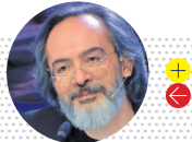
کارن همایونفر جوهری دیگر از میان ما رفت، ناصر طهماسب با صدای جادویی اش که تمام خاطرات ما از سینما بود.