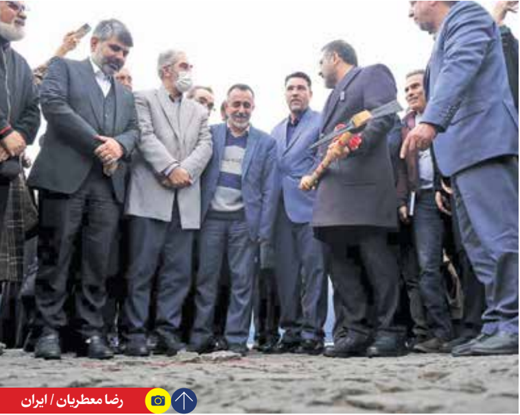
رضا معطریان / ایران

وزیر فرهنگ و ارشاد اسلامی: تئاتر شهر قلب تپنده هنر تهران و ایران است و با همه وجود تلاش می‌کنیم مشکلات داخل مجموعه برطرف شود که طبع بهسازی آن هم آماده است