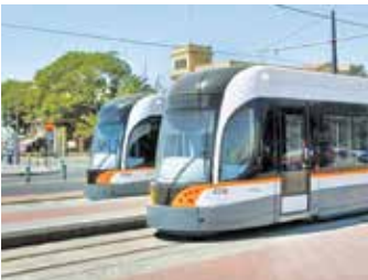
معاون شهردار تهران خبر داد