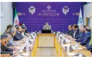
در مرکز بررسی های استراتژیک برگزار شد

به گزارش ایران، در پاسخ به این خواست «میخائیل باگدانف» معاون وزیر خارجه روسیه در دیدار با کاظم جلالی سفیر کشورمان روابط مسکو و تهران را روابطی دوستانه و ویژه برشمرد و تأکید کرد، احترام به حاکمیت، استقلال و تمامیت ارضی ایران و عدم مداخله در امور داخلی از اصول بنیادین در سیاست خارجی روسیه است. سفیر کشورمان نیز با تأکید بر حاکمیت بلافاصل و تاریخی ایران بر جزایر سه‌گانه ابوموسی، تنب کوچک و تنب بزرگ در خلیج فارس گفت، انتظار ما این است که مسکو با توجه به روابط رو به رشد با جمهوری اسلامی ایران، اجازه ندهد دشمنان روابط دو کشور از چنین مواضع و فضاهایی سوءاستفاده کنند.