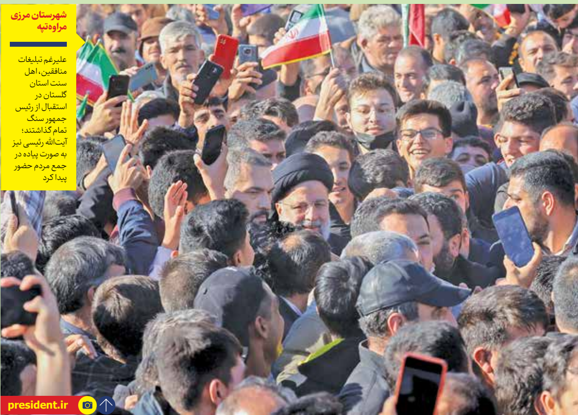
شهرستان مرزی مراوه تپه علیرغم تبلیغات منافقین، اهل سنت استان گلستان در استقبال از رئیس‌ی جمهور سنگ تمام گذاشتند؛ آیت‌الله رئیسی نیز به صورت پیاده در جمع مردم حضور پیدا کرد.

آیت‌الله رئیسی روز جمعه نیز در ادامه برنامه‌های سفر دوم دولت به استان گلستان، مورد استقبال گرم و پرشور مردم اهل سنت شهرستان مرزی مراوه تپه قرار گرفت. رئیس‌ی جمهور با حضور در اجتماع باشکوه مردم مراوه تپه، ضمن تشکر از استقبال گرم صورت گرفته، اهالی این منطقه مرزی را مردمانی برخوردار از اخلاق، ایمان و پیشینه تمدنی و فرهنگی غنی توصیف و تصریح کرد: هویت ملی و دینی این مردم سرمایه‌های بزرگ است که باید از گزند آسیب و هجوم حفظ شود. رئیس‌ی جمهور با بیان اینکه دولت مردمی اقدامات و برنامه‌های خود را بر اساس آمایش سرزمینی به عنوان منبای توزیع عادلانه ثروت طراحی و اجرا می‌کند، خاطر نشان کرد: نمی‌خواهم بگویم توجه ما بیشتر به مناطق محروم است، چرا که بیشتر مناطق کشور به لطف خدا از یک برخوردار نسبی بهره‌مند هستند، اما باید برای ارتقای این برخوردارها تلاش بیشتری کنیم. رئیس‌ی با اشاره به اینکه در دور اول سفرهای استانی دولت مردمی محور کار، شناسایی نیازهای ضروری و اولویت‌ها بود، گفت: بر اساس مصوبات دور اول سفر به استان گلستان، امروز کارهای خوبی در حوزه‌های عمرانی، اقتصادی، جاده‌های ارتباطی و آبرسانی در استان انجام شده است. رئیس‌ی جمهور با اشاره به اهمیت مسأله آبرسانی به روستاها، اظهار داشت: آبرسانی به روستاها از برنامه‌های جدی دولت است که ۱۰۰ میلیارد تومان اعتبار برای