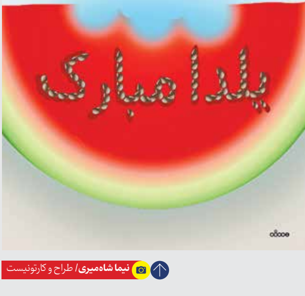
نویسنده و دبیر علمی شانزدهمین دوره جایزه ادبی جلال