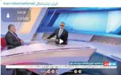
در مخالفت اولین فرمانده سپاه پاسداران گفته از سوی شورای نگهبان