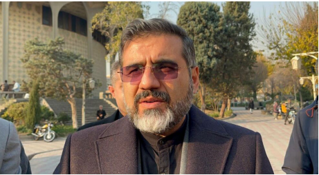
وزیر فرهنگ و ارشاد اسلامی خبرداد