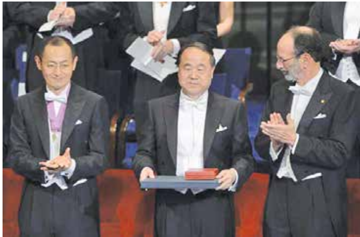
مویان در سال ۲۰۱۲ برنده جایزه نوبل ادبیات شد

کتاب را در دست گرفتم و به عنوانش خیره شدم: «ذرت سرخ» و فکر کردم ذرتی که سرخ است باید چه شکلی باشد؟ و بعد همین ذرت‌های سرزمین خودمان را با رنگ سرخ متصور شدم. و بعد ترش فکر کردم که اصلاً شاید این یک مفهوم انتزاعی است و استعاره‌ای بیش نباشد. اما در نهایت دست به دامان اینترنت شدم و با جست و جویی ساده ذرت‌های خوشه‌ای سرخی را دیدم که در چین رشد می‌کنند. من برای اولین بار، به واسطه عنوان یک کتاب، آن هم چه نوع کتابی؟ یک رمان، که بسیاری برای خواندن این گونه ادبی تکفیرمان می‌کنند، به وجود این نوع ذرت در پهنه گیتی پی بردم و این، کمترین کارکردمان است.