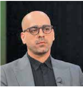
در مسکو ارتباط دارد؟ یعنی اهداف سفر رئیس جمهور روسیه بیشتر متمركز بر موضوع غزه است؟

از سوی دیگر سفر به امارات و عربستان پس از حکم دادگاه بین‌المللی مبنی بر بازداشت پوتین برای دستگاه سیاسی روسیه بسیار مهم است. رئیس جمهور روسیه از سوی دادگاه بین‌المللی به جهت حکم صادر شده تحت تعقیب است و کشورها موظف به دستگیری او هستند. همین مسأله منجر به احتیاط و به سفر به خارج از روسیه شده است. به همین دلیل او در نشست سران بریکس در آفریقای جنوبی یا نشست سران جی ۲۰ در هند حاضر نشد. بنابراین، سفر ولادیمیر پوتین به دو کشور مهم جنوبی خلیج فارس که متحد غرب و آمریکا به شمار می‌آیند، دارای اهمیت است. می‌توان گفت که با این سفر اثرگذار از دلایل موفقیت نسبی روسیه در جنگ با اوکراین و سرپا نگه داشتن اقتصاد این کشور، همکاری این دو کشور در کاهش تولید نفت در بازارهای جهانی بوده است. این دو کشور در همکاری و هماهنگی کامل با روسیه در تمام مدت جنگ اوکراین سعی کردند با پایین نگه داشتن میزان تولید نفت دقیقاً در تضاد منافع ایالات متحده و خواست این کشور، اجازه ندهند تا غیبت نفت روسیه در بازارهای جهانی با قیمت بالا بر شود و بدین شکل قیمت نفت را در این یک سال و نیمه‌ای که از جنگ اوکراین می‌گذرد، بالا نگه داشته و کمک شایانی به اقتصاد روسیه کردند. از همین رو سفر