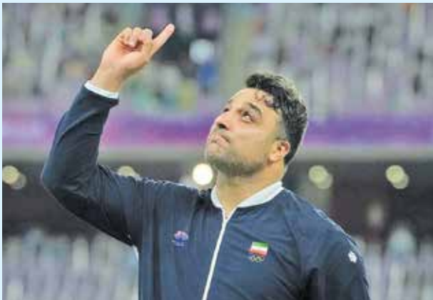
بازی‌های آسیایی گرفت، در المپیک چقدر می‌تواند موفق باشد؟ ایران نباید در المپیک دنبال ۷۰-۸

من از ایشان خواستم تا به مسئولان کشور بگویند به جوان‌ها بیشتر اعتماد کنند. به‌رحال جوان‌ها انگیزه زیادی برای کار دارند و از تجربیات آن‌ها استفاده شود. آقا هم گفتند حالا در ورزش همه جوان هستند علیرضا دبیر، هادی ساعی، حامد حدادی. توقع داریم که مدیران به جوان‌ها اعتماد کنند. من گفتم انگار ورزش اولویت نیست. اما بعد با صحبت‌های رهبری متوجه شدیم که باید باشد. همان‌طور که گفتند ورزش اولویت ایران است و هرچا ورزش خوبی