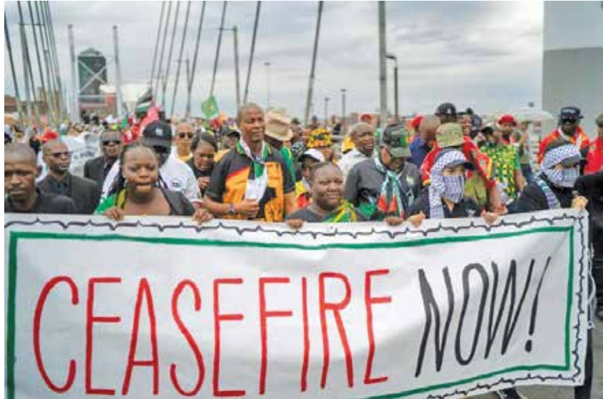
● ژوهانسبورگ

همچنین اسامه حمدان، رهبر حماس دیروز چهارشنبه گفت که تمدید آتش بس بشردوستانه در نوار غزه برای چند روز دیگر امکان پذیر است. رهبر حماس در اظهاراتی به العربیه گفت: «مذاکرات جاری درحال حاضر شامل چگونگی پایان جنگ و رفع محاصره غزه است.» حمدان با اشاره به اینکه شرایط برای آزادی اسرای نظامی کاملاً متفاوت خواهد بود، خاطرنشان کرد: «مذاکره درباره اسیران نظامی در گرو توقف جنگ است.» غازی حمد، یک عضو دیگر حماس نیز گفت: «حماس با همه طرف‌ها بویژه قطر و مصر برای طولانی‌تر کردن آتش بس بشردوستانه در نوار غزه همکاری می‌کند.» این رهبر جنبش حماس در اظهاراتی مطبوعاتی با بیان اینکه کشورهای غربی به ضرورت پایان دادن به جنگ اسرائیل علیه غزه متقاعد شده‌اند، خاطرنشان کرد: «عملیات طوفان الاقصی غرب و اسرائیل را مجبور به یافتن راه‌حل سیاسی کرد. ما از ماهیت پیچیدگی آگاه هستیم و در محاسبات دقیق با همه طرف‌ها حرکت می‌کنیم.»