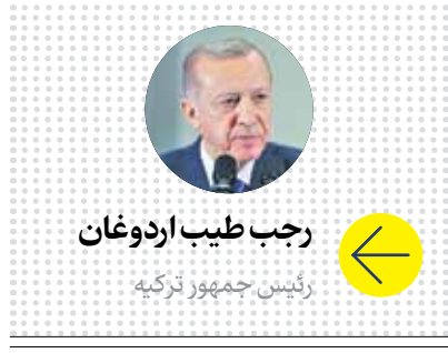
رجب طیب اردوغان

به گزارش رویترز، عبدالله دوم با تأکید بر اینکه محروم کردن انسان‌ها از آب، غذا، دارو و برق یک جنایت جنگی است، گفت: «در برابر این اقدامات نمی‌توان سکوت کرد. تداوم این دست مسائل می‌تواند منجر به وخامت شرایط انسانی در غزه شود. این حملات نه فقط با ارزش‌های انسانی که با حق حیات انسان‌ها نیز در تضاد است.» وی همچنین خواهان پایان جنگ در غزه شد و گفت: «برای مقابله با این اقدامات جنایتکارانه باید سازمان‌های جهانی وارد عمل شوند.» وی در این سخنان بار دیگر بر مخالفت کشورش با اشغال مجدد غزه و جدا کردن کرانه باختری از خاک فلسطین مخالفت کرد. او پیش‌تر نیز مخالفت خود را با کوچاندن فلسطینیان اعلام کرده بود.