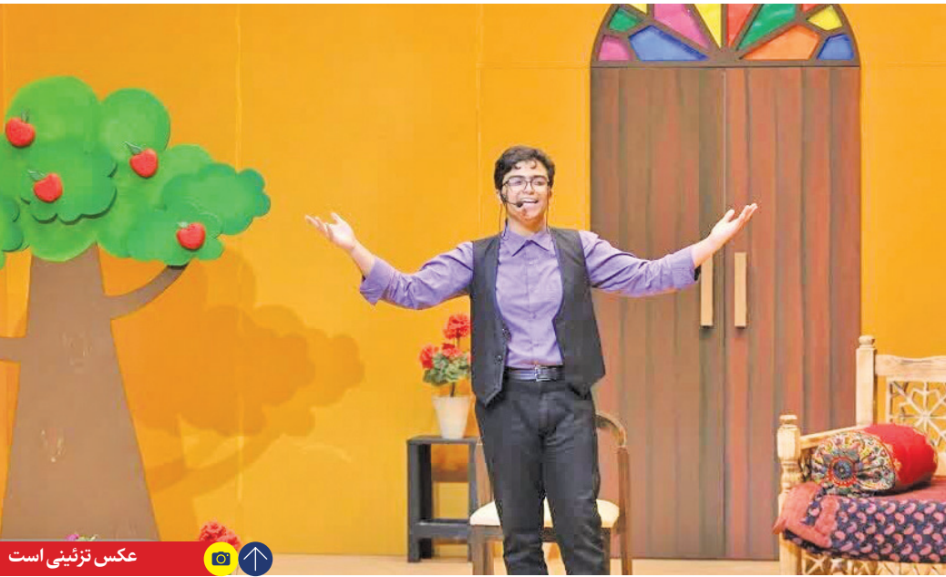
عکس تزئینی است

جای خالی افق عمار و مطالبه گری این مستند ساز ضمن تأکید بر لزوم وجود مستند های تحلیلی اشاره کرد: «ما نظرم، فلسطین برای مردم ما تبدیل به یک دغدغه شده است و شرایط اینگونه نیست که مستند ساز مجبور باشد این دغدغه مندی را شکل دهد. در حال حاضر مواجهه اصلی یک