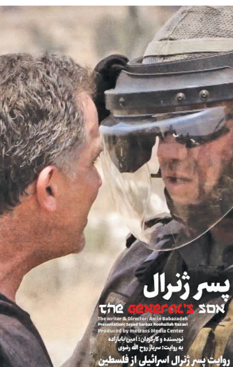
پسر ژنرال روایت پسر ژنرال اسرائیلی از فلسطین

اوبه سؤالی درباره ارزیابی آثار این حوزه و نقاط ضعف آن پاسخ می دهد: «در خصوص جهان اسلام، ما همیشه عقب هستیم. چون شاخک های اغلب مستند سازان ما، فقط به مسائل داخلی حساس بوده و هنوز بین المللی نشده است. آنها توانایی آن را ندارند که وقایع دنیا را رصد کنند و زمانی که مثلاً در پاکستان اتفاقی می افتد، بتوانند درک کنند که جایگاه ما در این موضوع، کجاست. فیلم های زیادی از جشنواره عمار به جشنواره های خارجی راه پیدا کرده اند اما نگاهی که دارند، نگاه درستی نیست. چون مستند ساز، نه مطالعه ای در مورد جهان اسلام دارد و نه تخصصی در آن. حداقل مسائل جهان اسلام، باید برای فرد دغدغه باشد و به دنبال آن، زاویه دید درستی هم اتخاذ کند. در حال حاضر متأسفانه، زاویه دیدها بسیار دم دستی و سطحی هستند. زاویه دیدی که مناسب واکاوی مسائل کشور است، برای مسائل جهان اسلام کارآمد نخواهد بود. جهان اسلام، نیاز به مطالعه دارد.» با با زاده افزود: «روند متداول این است که موسسه ای یک پروژه و دستمزدی را به فرد