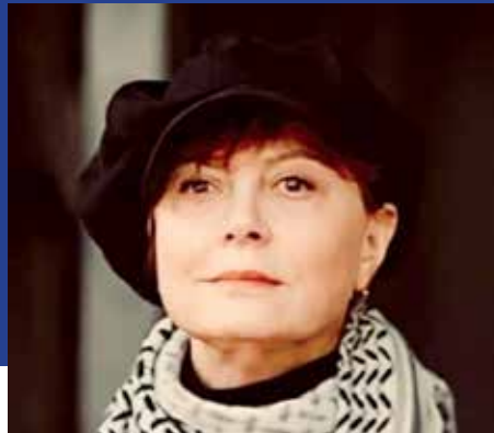
◀ سوزان سارانندون