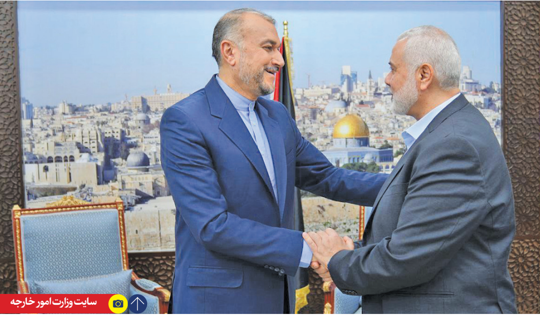
سایت وزارت امور خارجه