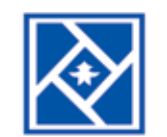
وزارت راه و شهرسازی شرکت عمران شهر جدید پردیس