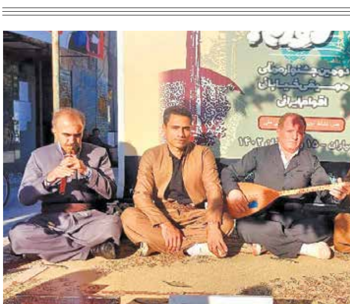
جشنواره موسیقی خیابانی کامیاران (کردستان)