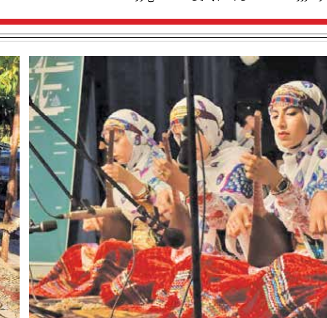
جشنواره تار آواز خراسان شمالی

از سریال‌های ترکیه‌ای نیز سخیف‌تر هستند! «مجیدی البته در ادامه صحبت‌هایش تلویزیون را هم مورد انتقاد قرار داده و از گسست تلویزیون با مخاطب گفته است: «تلویزیون نیز به دلیل گسستی که با مخاطب پیدا کرده تماشاگرانش به ۱۰ الی ۱۵ درصد رسیده است و بخشی از این درصد نیز بینندگان فوتبال هستند!» «بازنمایی مردم‌شناسی در سینما» عنوان کارگاه‌های آموزشی است که به‌عنوان برنامه‌های جانبی دومین جشنواره ملی چندرسانه‌ای میراث فرهنگی در موزه سینما برگزار می‌شود. اولین دوره این جشنواره سال گذشته در یزد برگزار شد و امسال قرار است از هشتم تا دهم آذر در قزوین برگزار شود. عصر شنبه اولین جلسه کارگاه آموزشی این جشنواره با تدریس مجید مجیدی برگزار شد. این سینماگر در بخشی از این کارگاه با اشاره به عظمت میراث فرهنگی ایران از ضرورت شناخت آن به جهانیان گفته