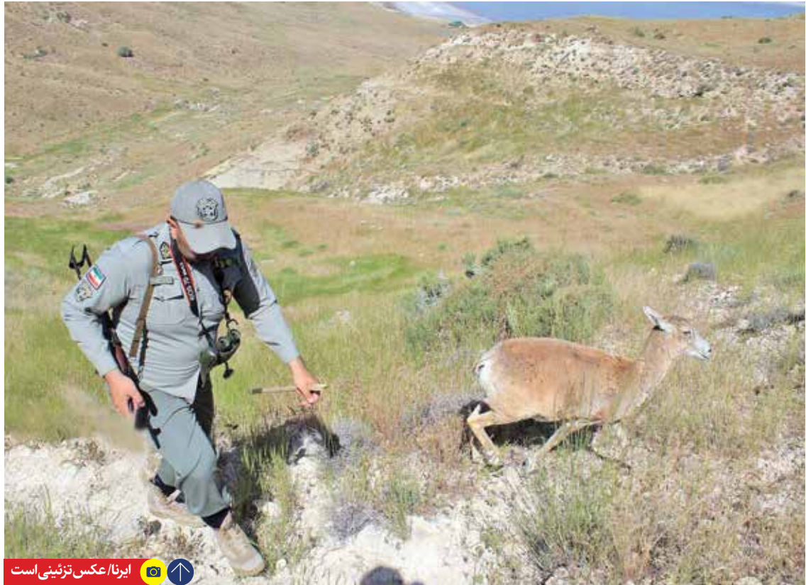
عکس تزئینی است