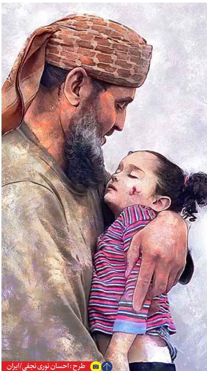
طرح: احسان نوری نجفی/ایران