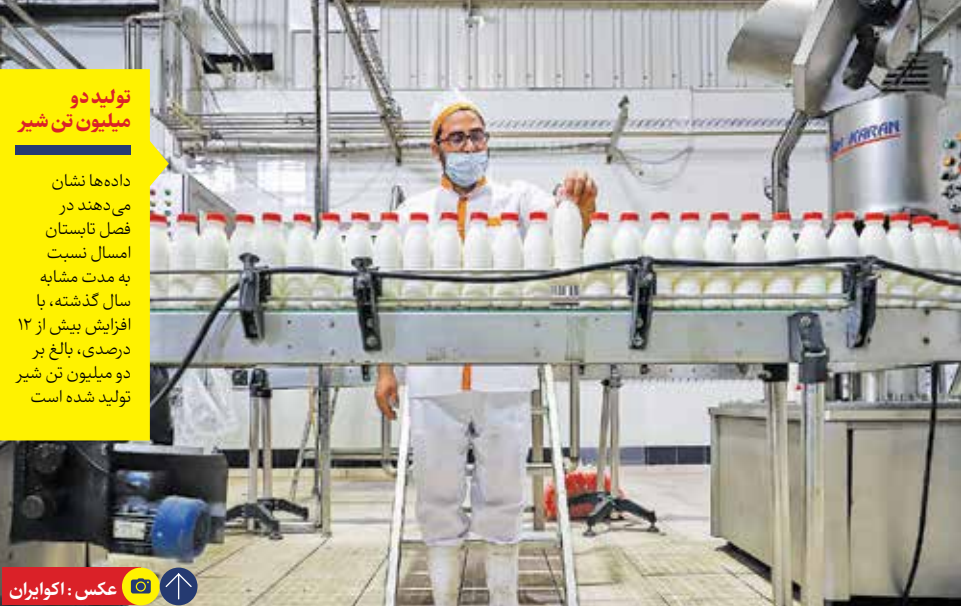
تولید دو میلیون تن شیر در دهان فصل تابستان امسال نسبت به مدت مشابه سال گذشته، با افزایش بیش از ۱۲ درصدی، بالغ بر دو میلیون تن شیر تولید شده است.

سال جاری افت ۲٫۸ درصدی داشته است. نرخ تورم نقطه به نقطه تولید شیر خام در گاوداری‌های صنعتی در فصل بهار امسال ۲۷٫۲ درصد بوده است.