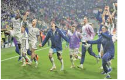
صعود جنجالی ایتالیا به یورو ۲۰۲۴