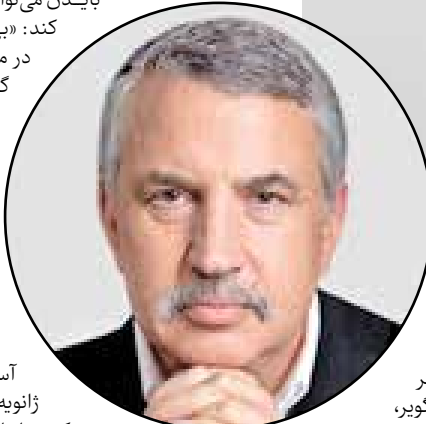
توماس ال فریدمن، ستون نویس مشهور روزنامه نیویورک تایمز

چرا نتانیاهو در تلاش است تا احتمال طرح تشکیلات خودگردان فلسطین به عنوان گزینه حکمرانی در غزه بسازد؟ او در بیان بی‌دردی زیرا او مدتی قبل تلاش برای حفظ قدرت پس از پایان جنگ را آغاز کرده و می‌داند که خیل عظیمی از اسرائیلی‌ها از او تقاضای کناره‌گیری خواهند کرد، چون او و یاران دست‌راستی‌اش با یک کودتای قضایی که منابع اطلاعاتی اسرائیل به نتانیاهو گفته بودند دشمنانی مانند حماس و حزب‌الله را جاسور و سوسه می‌کند، اسرائیل را متفرق و منحرف کردند. پیشنهاد برای بقای نتانیاهو تنها راهی که نتانیاهو می‌تواند در