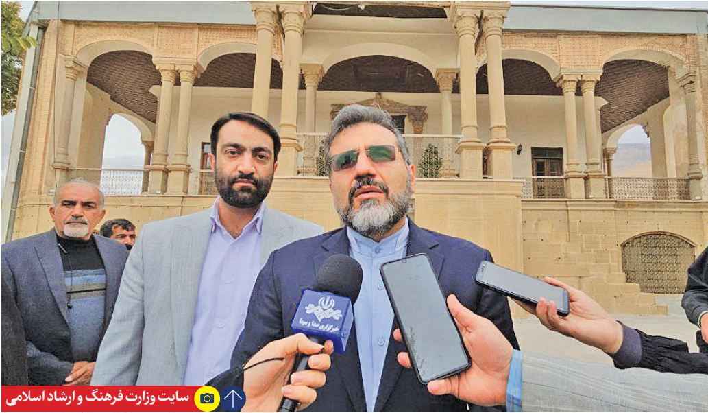
سایت وزارت فرهنگ و ارشاد اسلامی