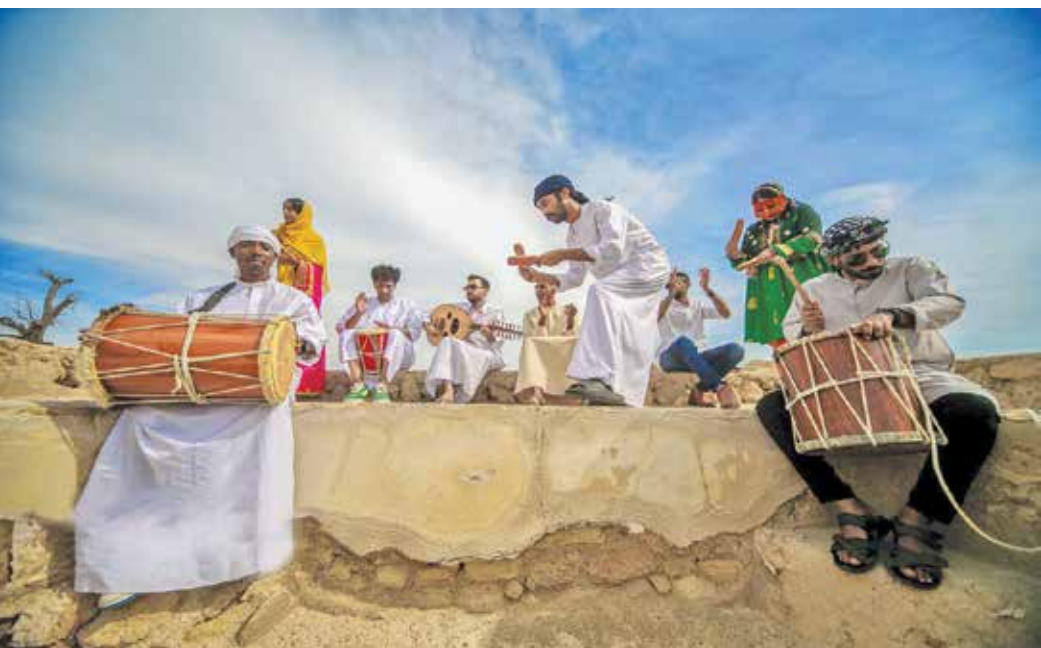
چهارمین جشنواره موسیقی کیش در این جزیره برگزار شد. در این جشنواره گروه‌های موسیقی از استان‌های هرمزگان، خوزستان، سیستان و بلوچستان و بوشهر حضور داشتند.