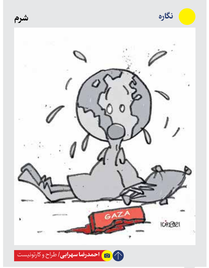
احمدرضا سهرابی / طراح و کارتون‌نویست