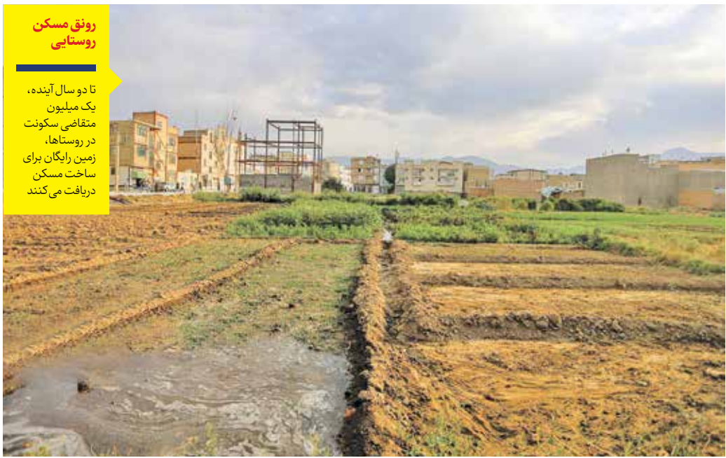
رونق مسکن روستایی تا دو سال آینده، یک میلیون متقاضی سکونت در روستاها، زمین رایگان برای ساخت مسکن در روستاها می کنند

اولویت عرضه زمین و مسکن روستایی به ساکنان روستا یا افراد بومی است که قصد مهاجرت معکوس از شهر به روستا را دارند