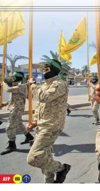
وضعیت داخلی اسرائیل و کابینه این